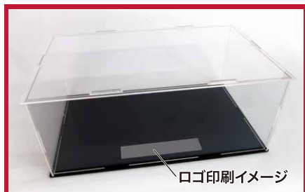
ロゴ印刷イメージ